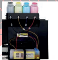
SISTEMA BULK INK