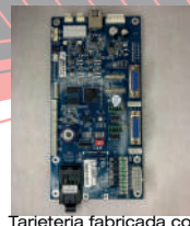
Tarjetería fabricada con especificaciones TAIMES, que aseguran la calidad durabilidad y estabilidad de nuestros equipos.