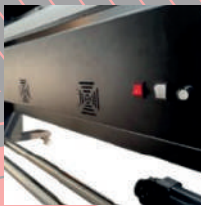
TIRA DE VENTILADORES Y RESISTENCIAS