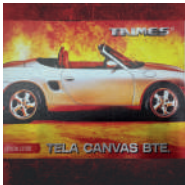
TELA CANVAS BRILLANTE